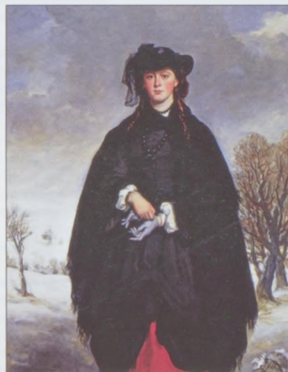
Франсис Грант. Анна Эмили София Грант. 1857. Холст, масло, 223,5×132,3. Национальная галерея Шотландии, Эдинбург