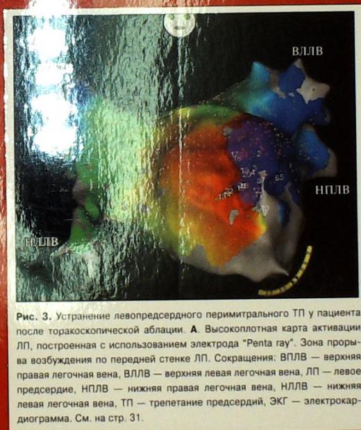
Рис. 3. Устранение левопредсердного перимитрального ТП у пациента после торакоскопической абляции. А. Высокорешетчатая карта активации ЛП, построенная с использованием электрода "Penta gau". Зона прорыва возбуждения по передней стенке ЛП. Сокращения: ВПЛВ — верхняя правая легочная вена, ВЛЛВ — верхняя левая легочная вена, ЛП — левое предсердие, НПЛВ — нижняя правая легочная вена, НЛЛВ — нижняя левая легочная вена, ТП — трепетание предсердий, ЭКГ — электрокардиограмма. См. на стр. 31.