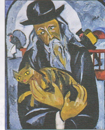
Natalia Goncharova. Rabbi (monk) with a cat. Around 1912. Oil on canvas, 100.2×92. National Gallery of Scotland, Edinburgh